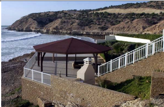
Vue sur la Résidence La Source où se déroulera la journée d'étude, un lieu paisible entre mer et montagne.